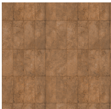
blacha rdzawo - czerwona